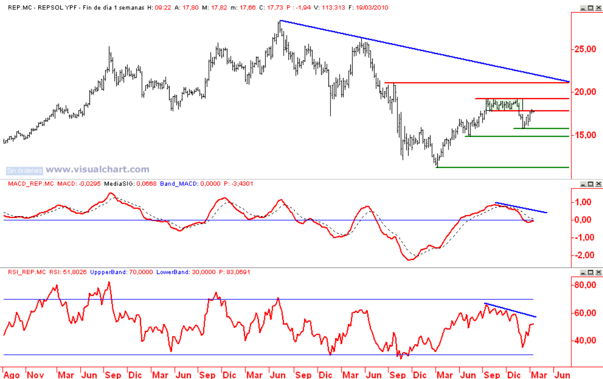
Repsol gráfico semanal (Soportes 15,81 y 14,86 / Resistencias 18,03 y 19,27)

... favorecen la apertura de posiciones cortas en búsqueda de soportes.