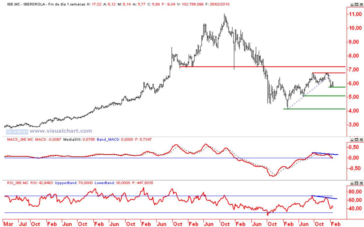
Iberdrola gráfico semanal (Soportes 5,75 y 5,12 / Resistencias 6,78 y 8,06)

...permite trabajar con un escenario favorable a mayores cesiones.