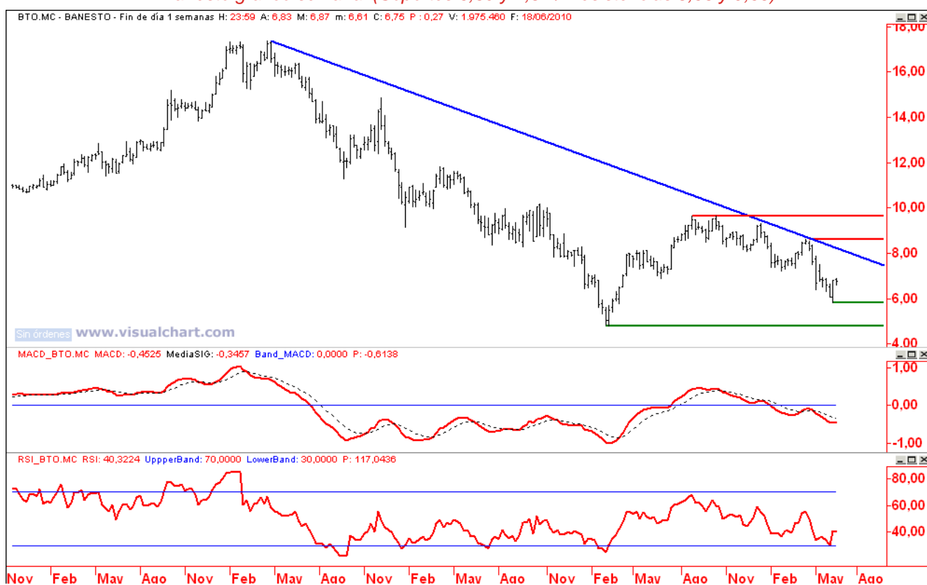
Banesto gráfico semanal (Soportes 6,30 y 4,84 / Resistencias 8,63 y 9,65)

Aprovechamos aproximaciones a resistencias, 7,49, para abrir posiciones cortas y acompañamos la pérdida de soportes.