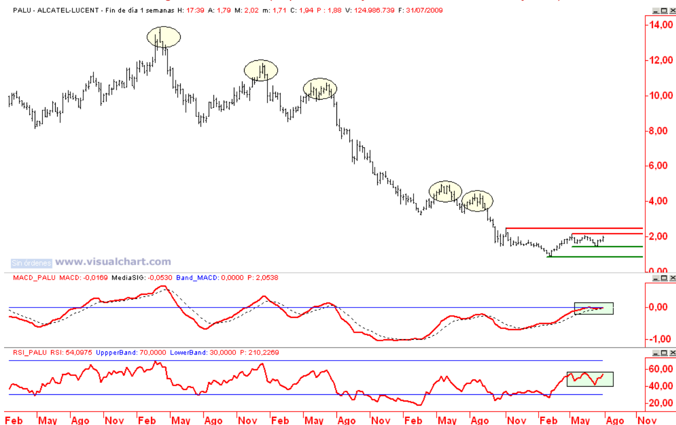
Alcatel gráfico semanal (Soportes 1,46 y 0,87 / Resistencias 2,16 y 2,49)

...la ruptura de los niveles más próximos permite posicionarse a favor de un movimiento de mayor recorrido sin asumir un stop amplio en términos de volatilidad.