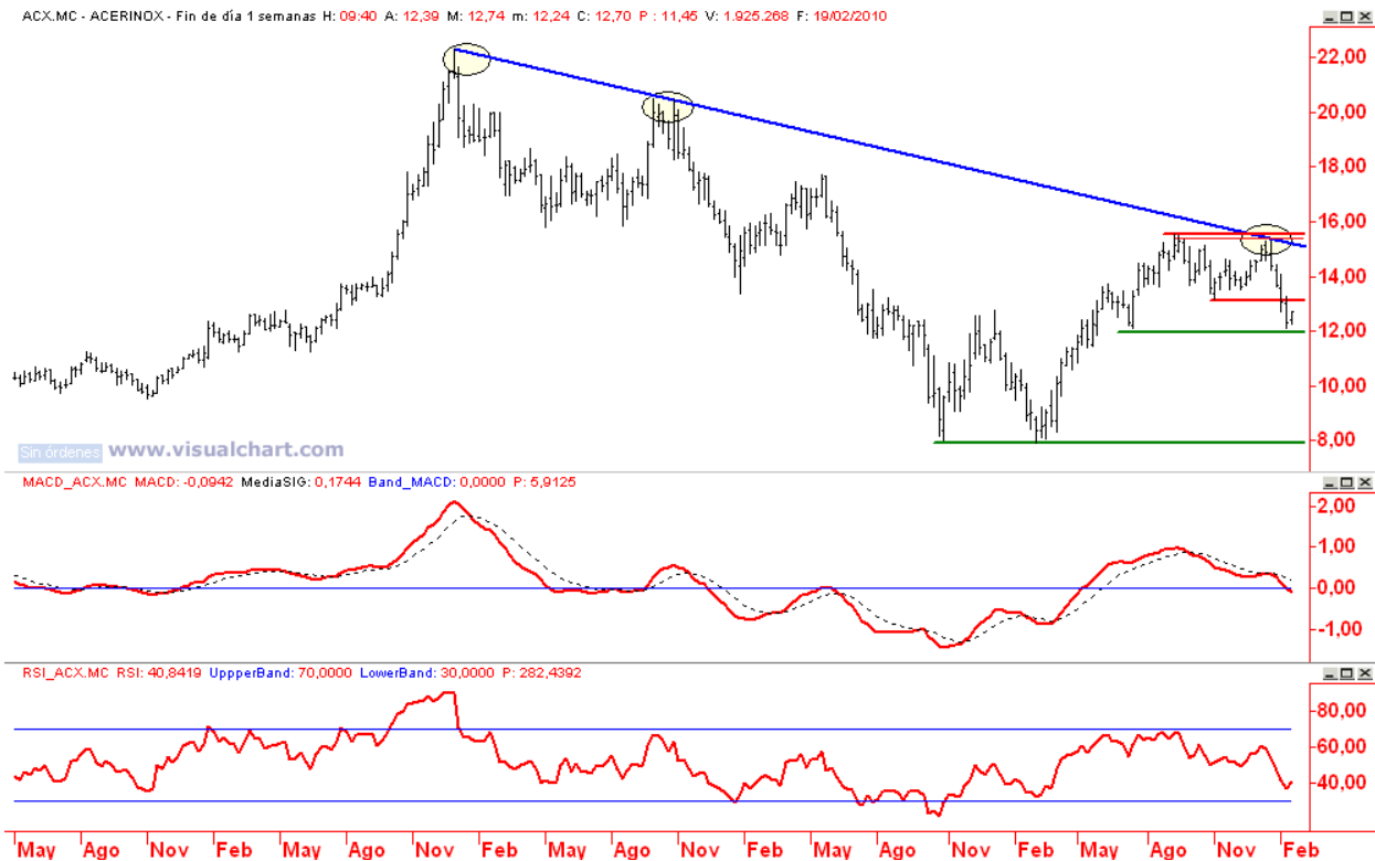
Acerinox gráfico semanal (Soportes 12,09 y 7,92 / Resistencias 13,17 y 15,55)

... permite aprovechar el actual rebote de corto plazo para abrir posiciones cortas a favor de la tendencia primaria.